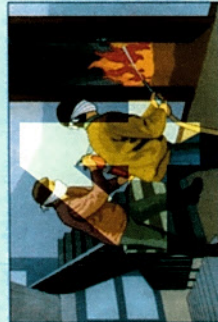
Использовать первичные средства пожаротушения