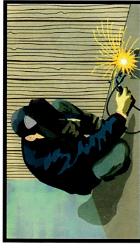
Нарушение правил проведения сварочных работ