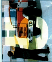
Встретить пожарные подразделения