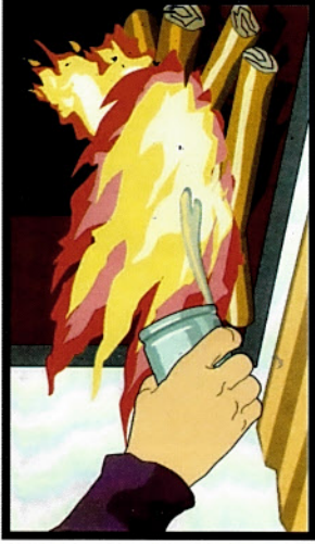
Применение для розжига пёчей легковоспламеняющихся и горючих жидкостей, выпадение углей, трещин в кладке, возгорание сажи в дымоходах.