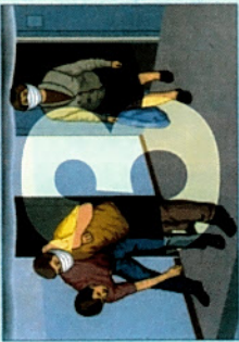
Эвакуировать людей из помещений