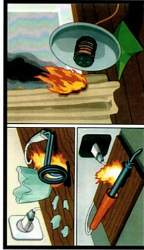
Оставление без присмотра электронагревательных приборов