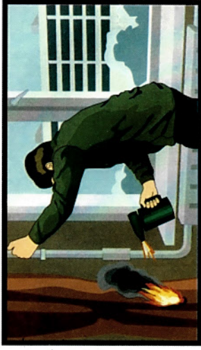
Отогревание замёрзших труб паяльными лампами и факелами